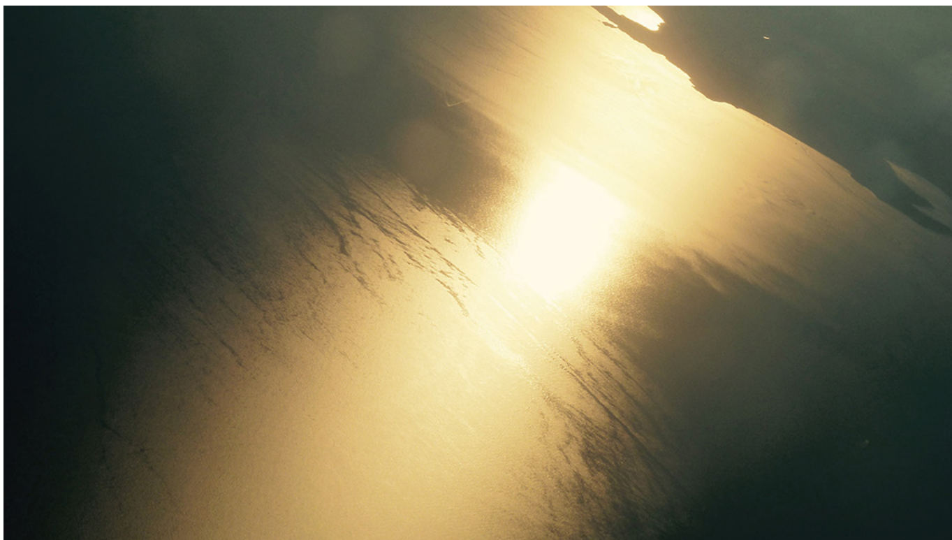
Image extraite de la vidéo WetWetWet , 2015