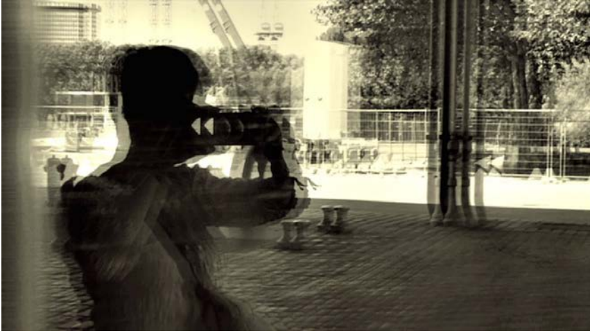
Image extraite du vidéo-poème I & THEM