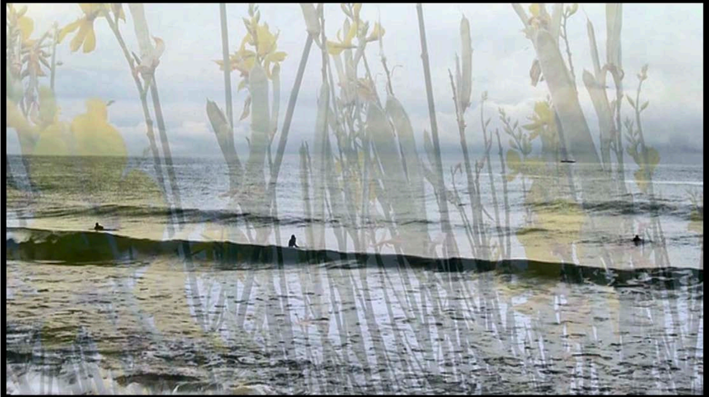
Images extraites des vidéos Gaps , 2014 (en haut) et @TENDRE , 2021 (en bas)